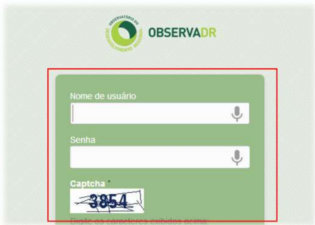
Imagem 1.1 – Tela de login